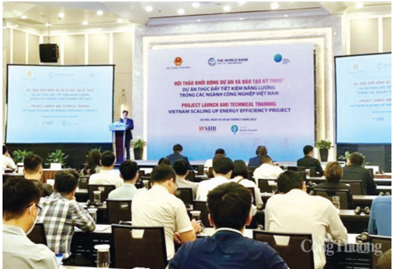
Hội thảo thúc đẩy tiết kiệm năng lượng ngành Công nghiệp Việt Nam

Thực tế cho thấy, hiện các ngành công nghiệp của Việt Nam chiếm hơn 47% tổng tiêu thụ năng lượng toàn quốc. Từ các khảo sát của Chương trình Quốc gia về sử dụng năng lượng