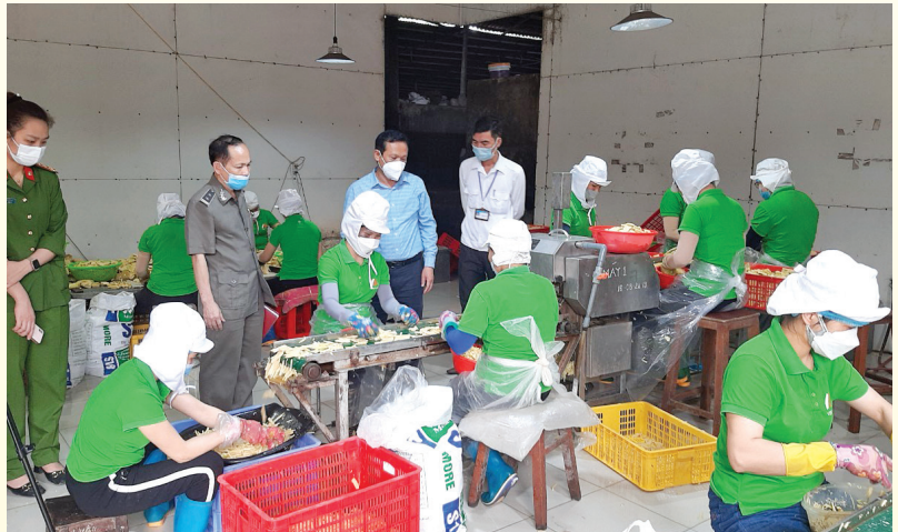
Đoàn kiểm tra an toàn thực phẩm

Mục đích của công tác kiểm tra nhằm kịp thời phát hiện, chấn chỉnh những bất cập, yếu kém, sai phạm trong công tác an toàn thực phẩm, phát hiện, ngăn chặn, xử lý kịp thời các trường hợp vi phạm về an toàn thực phẩm, đồng thời đề xuất các giải pháp nâng cao hiệu quả công tác quản lý an toàn thực phẩm, trong quá trình kiểm tra kết hợp làm tốt công tác tuyên truyền, giáo dục kiến thức, pháp luật về an toàn thực phẩm, xử lý nghiêm các trường hợp vi phạm, qua đó