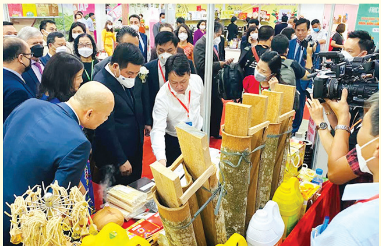
Các đại biểu tham quan gian hàng trưng bày sản phẩm của tỉnh Yên Bái.

cùng doanh nghiệp trong kỷ nguyên số” được tổ chức theo hai hình thức trực tiếp và trực tuyến.