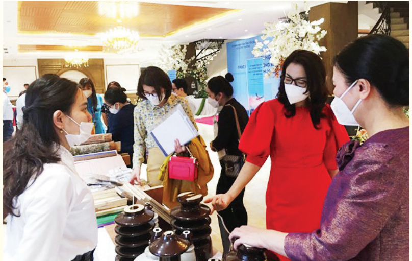
Các đại biểu tham quan các gian trưng bày sản phẩm xuất khẩu của tỉnh.

Yên Bái hiện có khoảng 74 doanh nghiệp hoạt động xuất nhập khẩu trực tiếp đến khoảng 50 thị trường truyền thống như Trung Quốc, Ấn Độ, Hàn Quốc, Đài Loan, Nhật Bản, Mỹ... Trong đó, nhóm công nghiệp và chế biến khoáng sản và nhóm hàng may mặc là nhóm hàng hóa chiếm tỷ trọng cao trong cơ cấu xuất khẩu của tỉnh. Xu hướng các sản phẩm xuất khẩu của tỉnh đã chuyển từ sản phẩm thô sang sản phẩm chế biến sâu. Mặc dù chịu tác động không nhỏ bởi dịch COVID-19 nhưng với sự cố gắng, nỗ lực của tỉnh Yên Bái trong việc xây dựng các giải pháp ứng phó với tình huống đại dịch Covid-19, giá trị xuất khẩu của tỉnh vẫn có những kết quả khả quan. Chỉ tính riêng quý I/2022 giá trị xuất khẩu đạt 62,2 triệu USD, đạt 100% kịch bản, bằng 22% kế hoạch năm, tăng 24% so với cùng kỳ, tương đương 11,9 triệu USD. Trong bối cảnh một số thị trường xuất khẩu truyền thống, chủ lực của tỉnh bị ảnh hưởng do đại dịch Covid-19 nhưng giá trị xuất khẩu của tỉnh vẫn tăng so với năm 2020 và vượt kế hoạch đề ra cho thấy các doanh nghiệp xuất khẩu đã tìm kiếm được thị trường thay thế