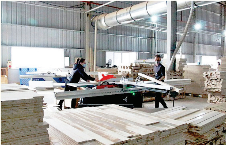
Tỉnh Yên Bái thu hút trên 430 dự án đầu tư vào lĩnh vực công nghiệp, xây dựng

đăng ký 300 tỷ đồng; Dự án đầu tư xây dựng nhà máy gia công, sang chai đóng gói thuốc bảo vệ thực vật, thuốc trừ côn trùng và sản xuất