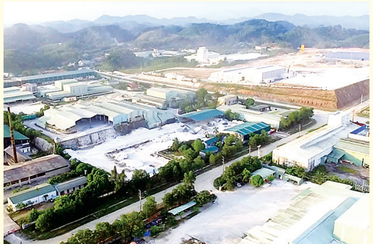
Một góc khu Công nghiệp phía Nam tỉnh Yên Bái

Hiện nay tỉnh Yên Bái có 3 khu công nghiệp với tổng diện tích 627,89ha (KCN phía Nam với diện tích 400 ha; KCN Minh Quân gần 108 ha và KCN Âu Lâu 120 ha). Đến hết năm 2021 thu hút được 84 dự án đầu tư gồm: 73 dự án vốn đầu tư trong nước (DDI) và 11 dự án vốn đầu tư nước ngoài (FDI), với tổng vốn đầu tư đăng ký 14.207 tỷ đồng, tổng diện tích đất đăng ký đạt 455,89ha. Tỷ lệ lấp đầy trung bình