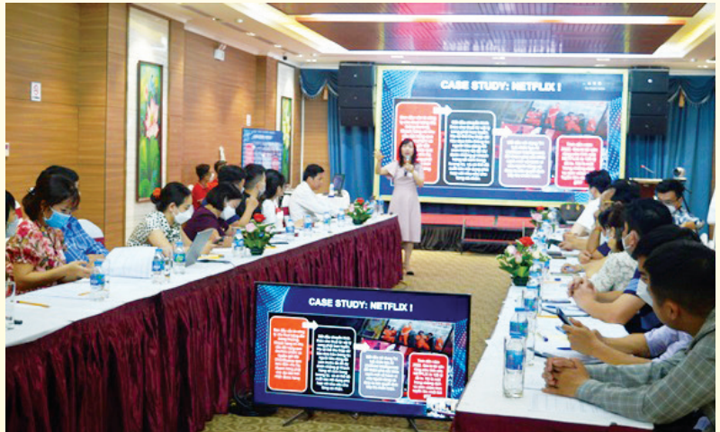
Quang cảnh lớp tập huấn tại điểm cầu thành phố Yên Bái.

Tham dự lớp tập huấn có cán bộ, lãnh đạo Phòng Kinh tế, Kinh tế hạ tầng các huyện, thị xã, thành phố, Liên minh hợp tác xã, các doanh nghiệp trên địa bàn tỉnh bằng hình thức trực tiếp tại thành phố Yên Bái và trực tuyến tại điểm cầu các huyện: Lục Yên, Văn Yên, Trạm