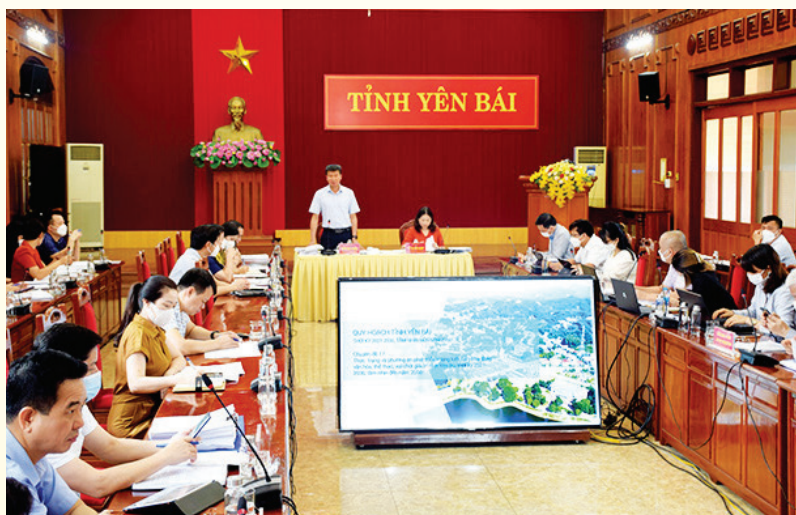
Đồng chí Chủ tịch UBND tỉnh Trần Huy Tuấn phát biểu kết luận tại buổi làm việc

Sau khi nghe đơn vị tư vấn trình bày tóm tắt nội dung chuyên đề các đại biểu đã tham gia thảo luận cho ý kiến tham gia vào nội dung của chuyên đề. Về thực trạng các số liệu được trích dẫn lấy từ nguồn dữ liệu tại Nghị quyết, đề án, báo cáo, số liệu của tỉnh, Sở Công Thương và phân tích của nhóm tư vấn. Về nội dung chuyên đề đã cơ bản bám sát các chủ trương, chính sách của Đảng và Nhà nước và các văn bản quy định của Trung ương, của tỉnh. Tuy nhiên, các đại biểu cho rằng chuyên đề còn nhiều điểm cần làm rõ, trong đó phân phương hướng cần đưa ra dự báo về các yếu tố và xu