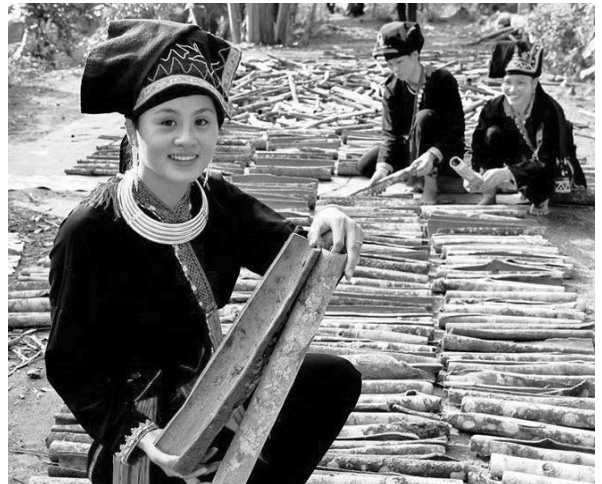
Mùa vụ quế Văn Yên, Yên Bái

So với nhiều cây trồng khác, cây Quế đã mang lại cho người dân một nguồn thu lớn và ổn định. Vùng Quế Văn Yên từ vài chục năm nay đã nổi tiếng trên thế giới, tháng 01 năm 2010 Cục Sở hữu trí tuệ (Bộ KH-CN) đã có quyết định chứng nhận đăng ký chỉ dẫn địa lý cho sản phẩm Quế Văn Yên. Trước đây, cây