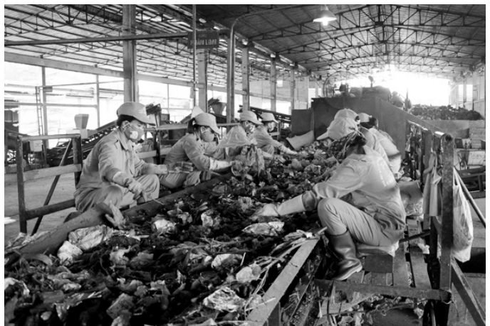
Thu gom xử lý chất thải rắn là một trong nhiều ngành nghề nằm trong danh mục tỉnh Yên Bái khuyến khích đầu tư vào các khu công nghiệp.

Các ngành nghề được khuyến khích đầu tư trong lĩnh vực chế biến khoáng sản bao gồm: