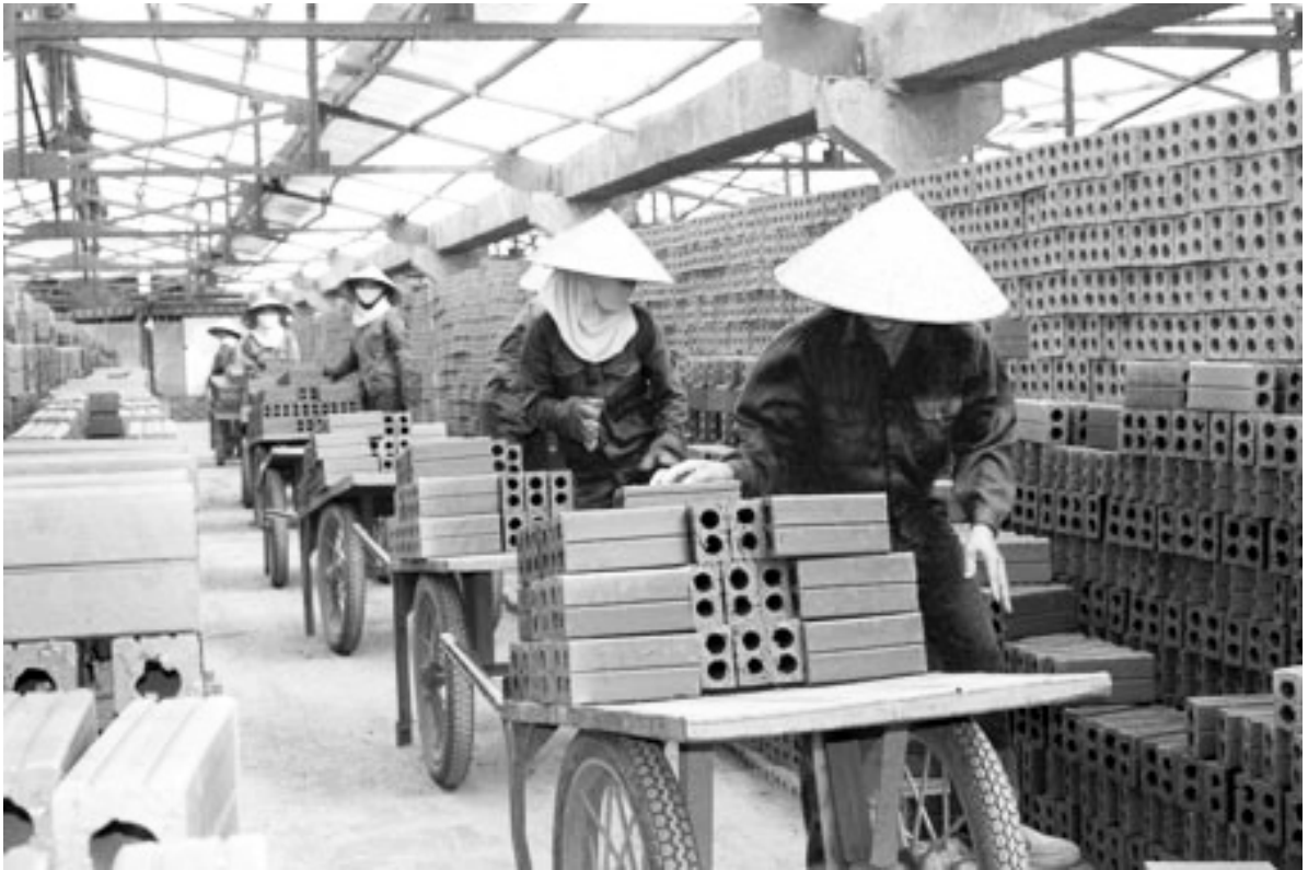
Sản xuất gạch không nung tại Yên Bái