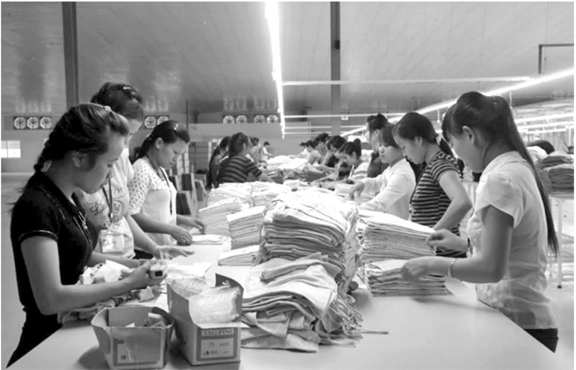
Công nhân Công ty TNHH Quốc tế Vina KNF, thị trấn Cổ Phúc, huyện Trấn Yên hoàn thiện sản phẩm.

cường quản lý và siết chặt hoạt động thương mại biên giới.