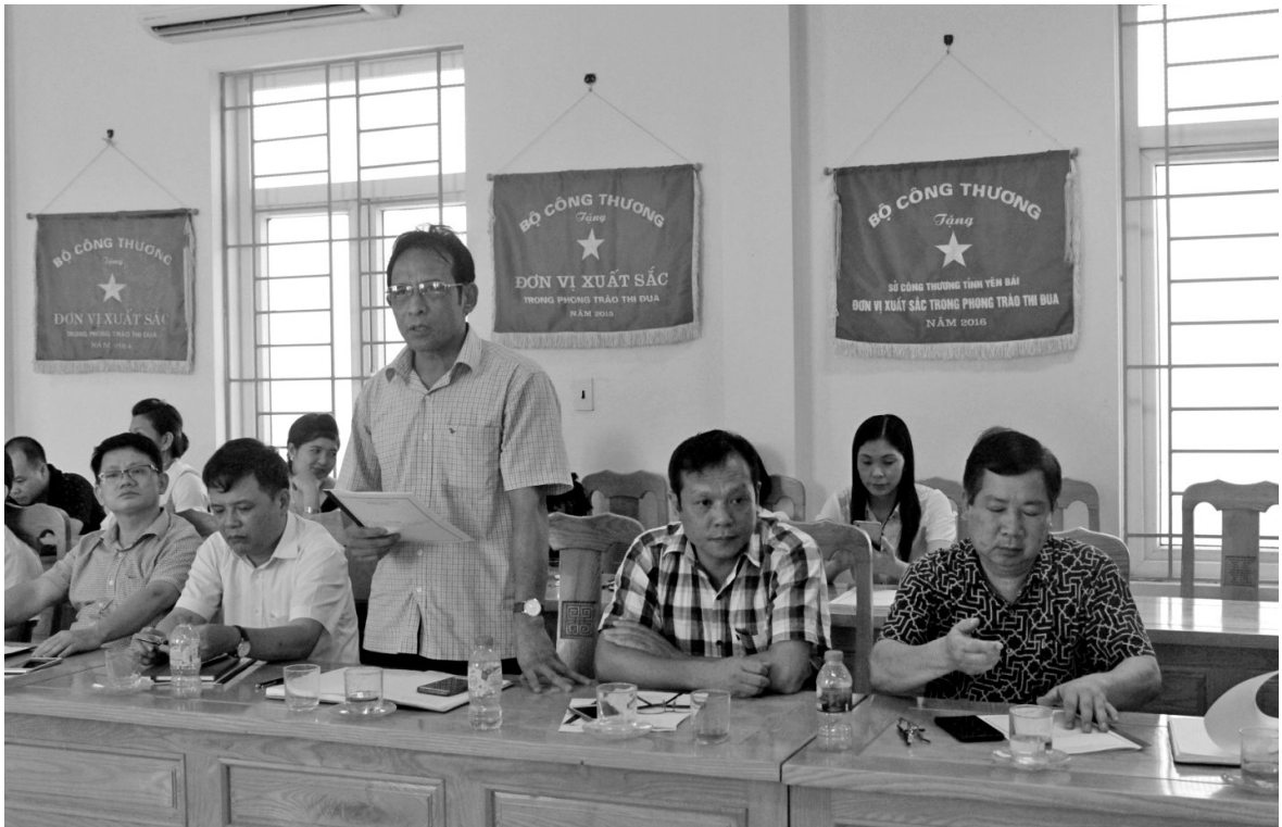
Đại diện Công ty TNHH chế biến chè Hữu Hào tham gia ý kiến

thiệu sản phẩm, thông tin về việc xây dựng thương hiệu sản phẩm.