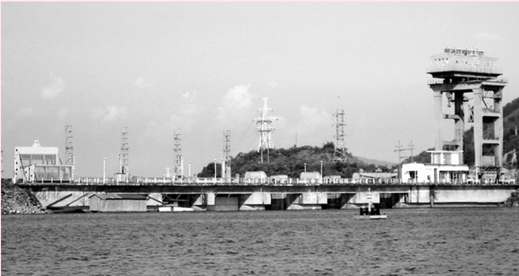
Thủy điện Thác Bà trên hồ Thác Bà.

Cụ thể, danh mục 18 đập, hồ chứa thủy điện thuộc loại đập, hồ chứa nước quan trọng đặc biệt gồm: