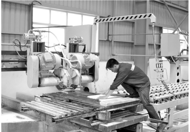
Công ty TNHH Đá cẩm thạch R.K Việt Nam

Khuyến công quốc gia: Được Bộ Công Thương phê duyệt 03 đề án với tổng kinh phí 900 triệu đồng. Hiện đang triển khai các bước tiếp theo kế hoạch. Phối hợp với các cơ sở