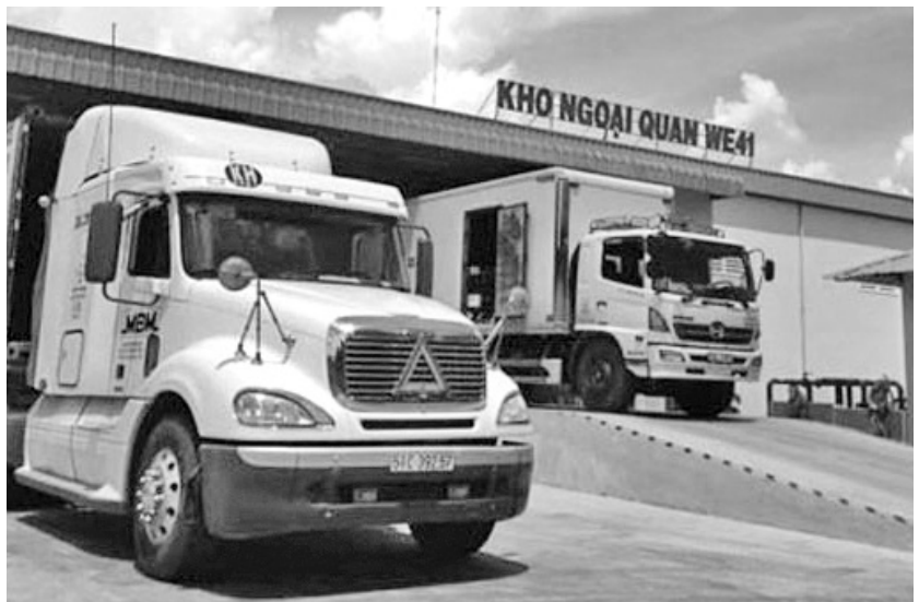
Đầu tư kho ngoại quan gần các cửa khẩu với Trung Quốc sẽ đảm bảo chất lượng nông sản xuất khẩu.

Vậy nên gần đây, nhiều tiêu chuẩn đối với hàng hóa nhập khẩu do phía Trung Quốc đề ra đã có phần khắt khe hơn. Nếu muốn giữ chân tại thị trường này, nhà sản xuất cũng như các doanh nghiệp (DN) xuất khẩu của Việt Nam cần