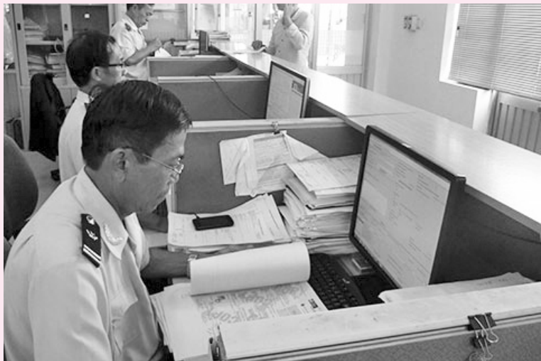
Kiểm soát giấy chứng nhận xuất xứ tránh việc hàng hóa đội lốt hàng Việt xuất đi nước thứ ba.

tra rất kỹ chứng nhận xuất xứ. Đây là việc cần kiểm soát chặt chẽ, bởi một số doanh nghiệp khi xuất sang các