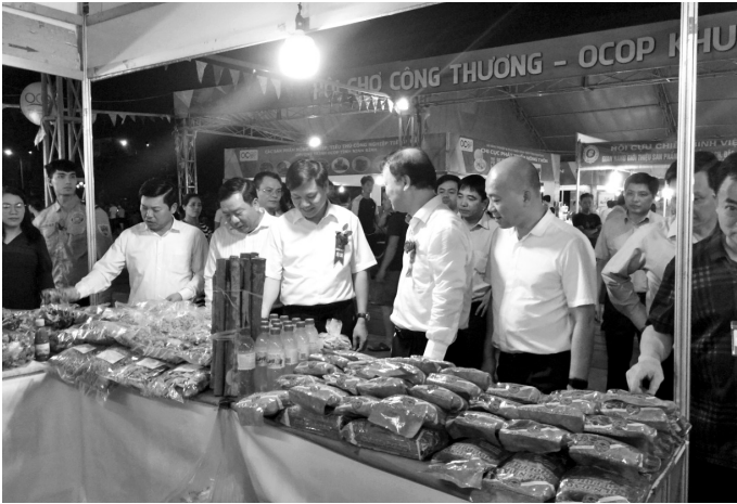
Lãnh đạo Bộ Công Thương, Cục Xúc tiến thương mại đến thăm gian hàng tỉnh Yên Bái